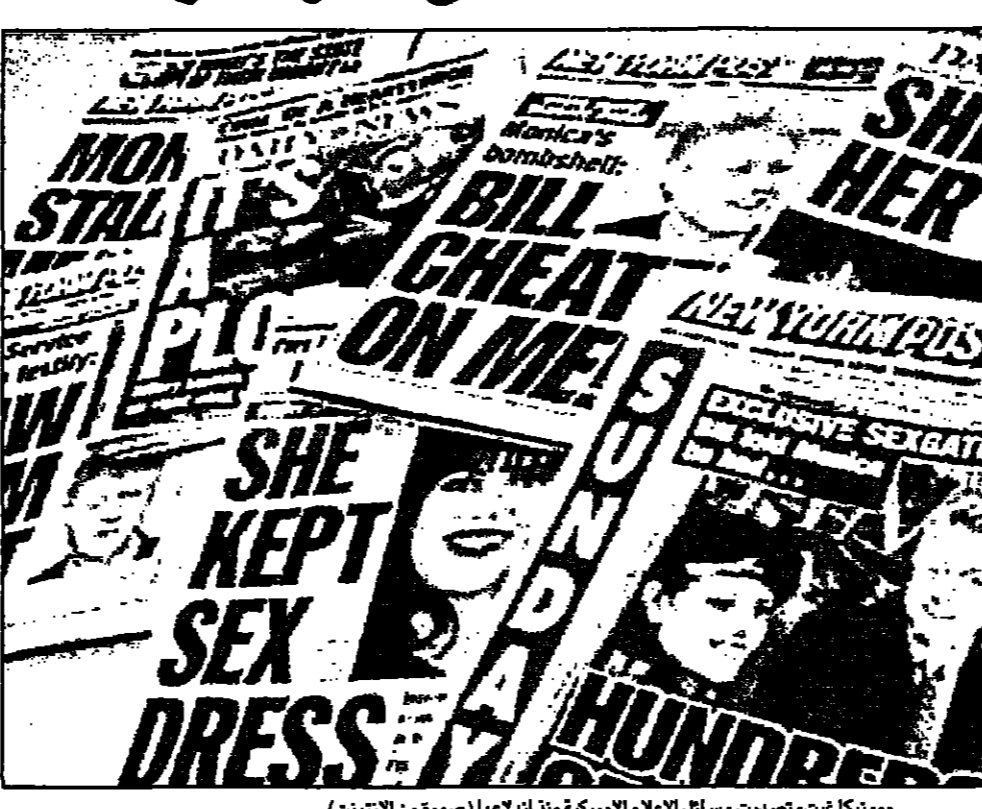
مونیکا غيت، صدمت وسائل الاعلام الأمريكية منذ انلاعها

والاعتراف بنوع ما من العلاقة الجنسية مع مونیکا لويديكي المثيرة السابعة التي ابرئها من اتهامات جنسية من قبل زوجها. واعترافه بالجنس مع مونیکا لويديكي المثيرة السابعة التي ابرئها من اتهامات جنسية من قبل زوجها. واعترافه بالجنس مع مونیکا لويديكي المثيرة السابعة التي ابرئها من اتهامات جنسية من قبل زوجها.